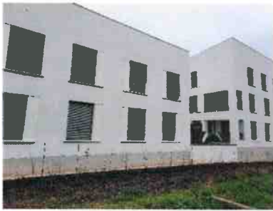
Nouveaux logements sur Arpajon