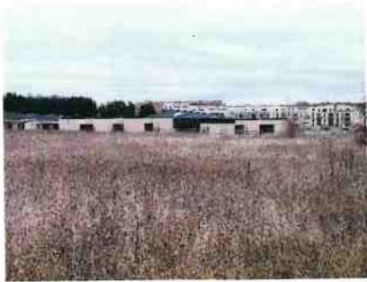
Vue sur le groupe scolaire et en arrière plan, les nouvelles constructions sur Arpajon