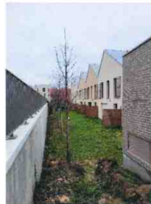
Espaces verts à l'arrière de maisons de ville sur Arpajon