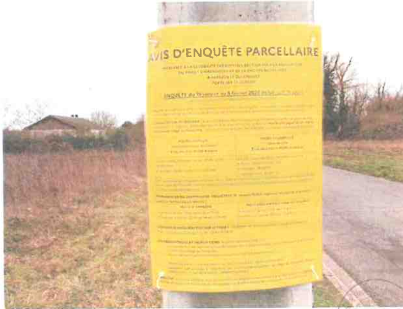
Panonceau 3 :

JL/27 JANVIER 2026 REFERENCES A RAPPELER: MD:211595