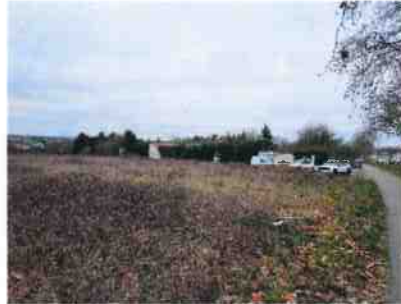
Vue sur la zone à acquérir avec des habitations habitées sur Ollainville