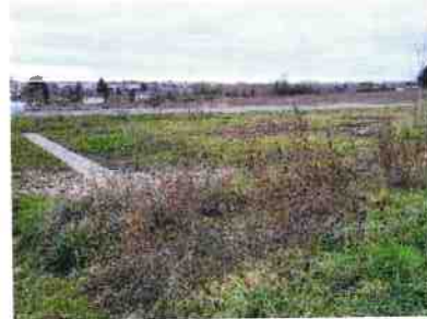
Bassins de régulation pluvial de la ZAC