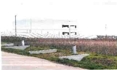
Bâtiment industriel en construction sur zones d'activités d'Arpajon