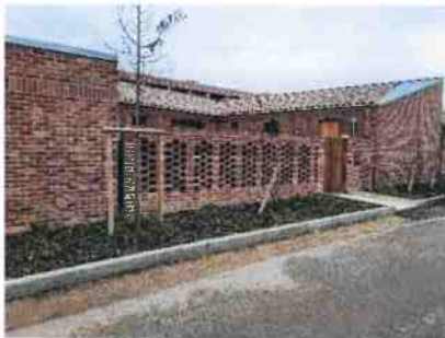
Maisons individuelles de ville sur Arpajon