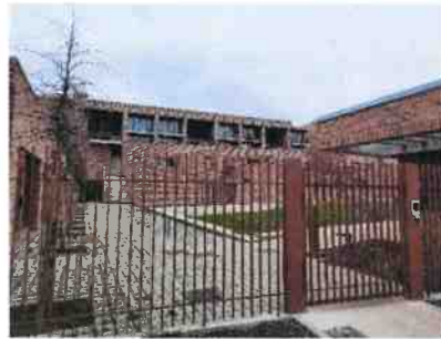
Autre typologie de logements sur Arpajon