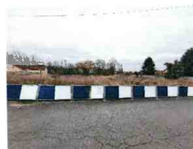
Terrain sur Ollainville devant subir des évolutions en phase 3