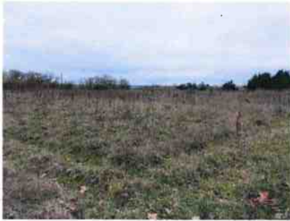
Vue des terrains sur Ollainville restant à acquérir