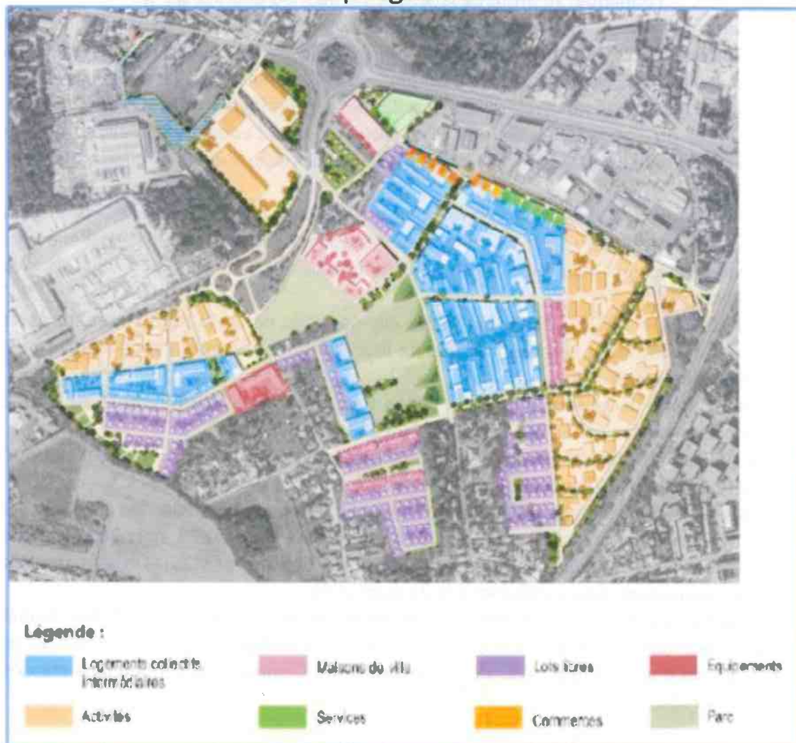
Répartition géographique indicative des fonctions programmatiques du projet