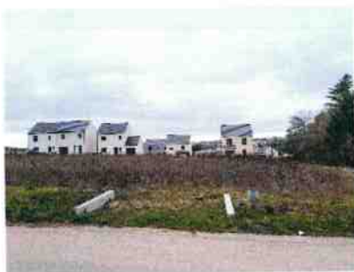
Habitations individuelles en constructeurs libres sur Arpajon