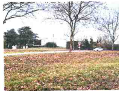
Vue des bâtiments industriels sur la zone d'activités sur Ollainville