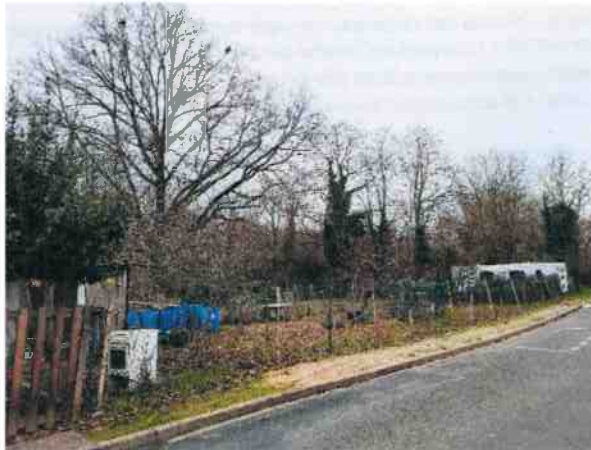
Boisements qui seront sauvegardés dans le cadre des évolutions de la phase 3