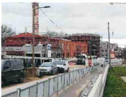
Nouvelles constructions en cours le long des bassins pluviaux