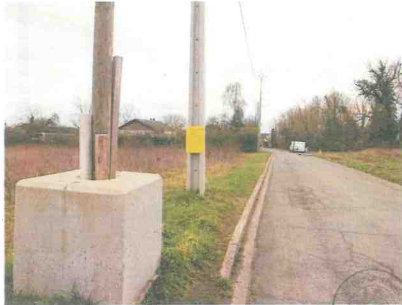
Panonceau 2 :

J1 /27 JANVIER 2026 REFERENCES A RAPPELER: MD:211595