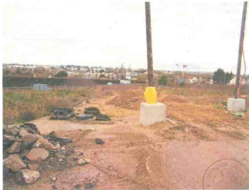
Panonceau 4 :

JL/27 JANVIER 2026 REFERENCES A RAPPELER: MD:211595