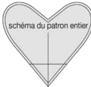
schéma du patron entier