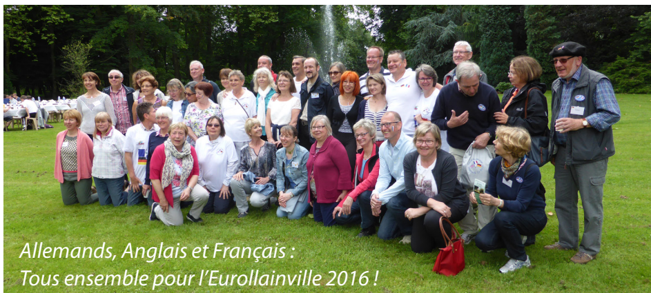
Allemands, Anglais et Français : Tous ensemble pour l'Eurollainville 2016 !

Siège social : 2, rue de la Mairie, 91340 Ollainville