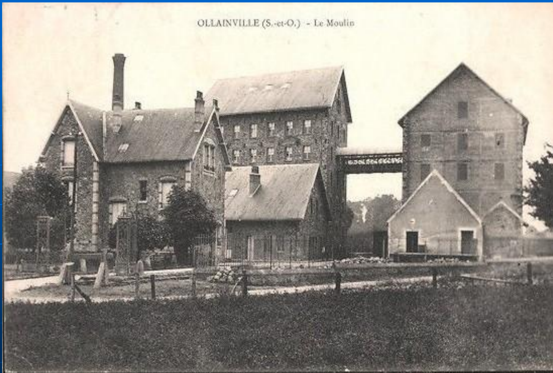
OLLAINVILLE (S.-et-O.) - Le Moulin