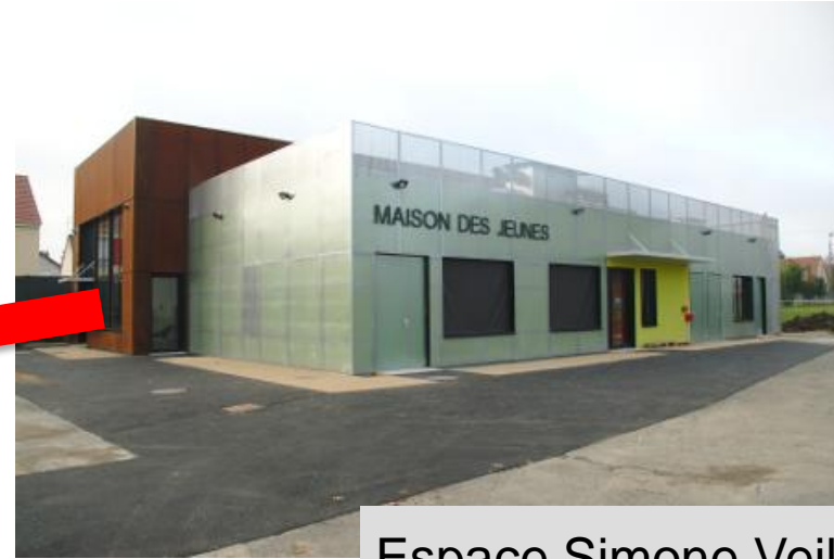
Espace Simone Veil