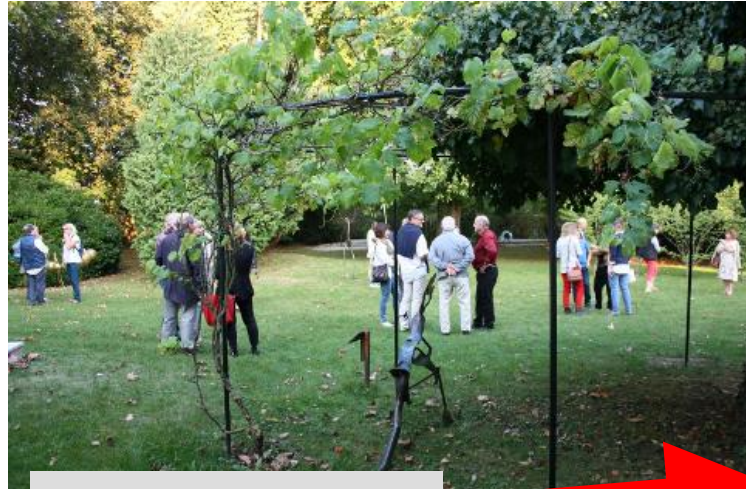
Parc de la mairie