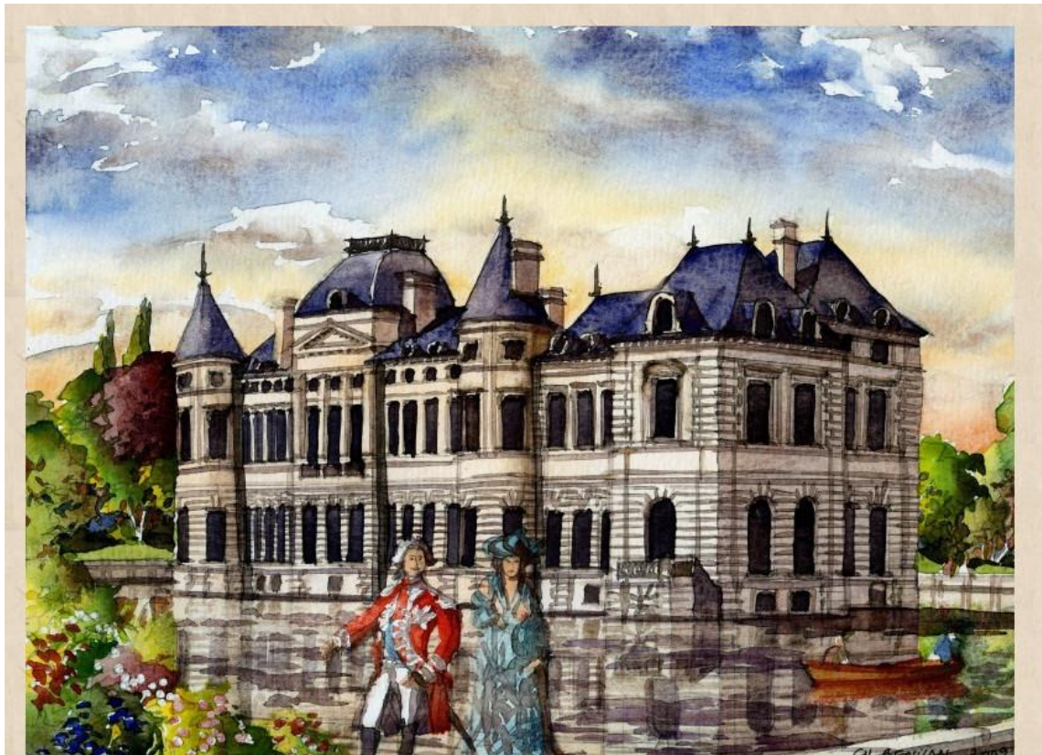
Château d'Ollainville, Michel de Marillac, Charles du Mouceau de Nolan, Boucaud, prince de Rohan, maréchal duc de Castries, comte de Saint-Maur, vers 1785. Démoli en 1831.